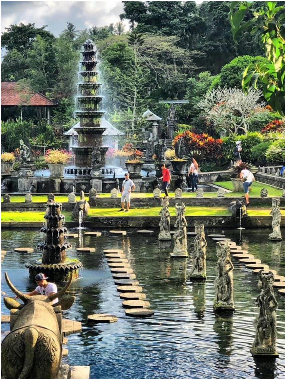
Borítókép: The Kayon Jungle Resort by Pramana.

https://promotions.hu/orszagos/gasztro-utazas/2019/06/20/jurak-zsolt-utazas-nyaral-as-pihenes-video/