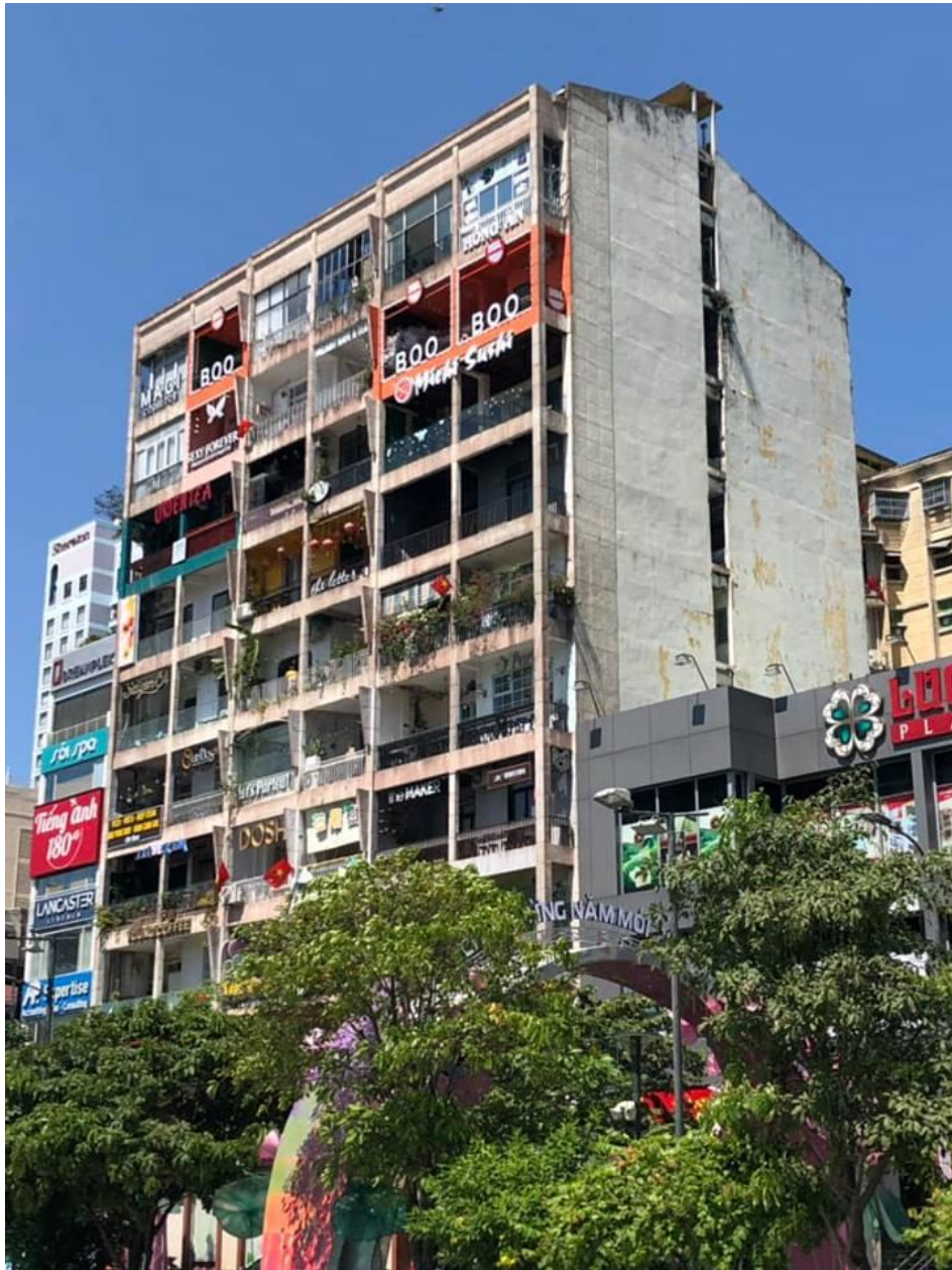
A kilenc emeletes épületben korábban lakások voltak.