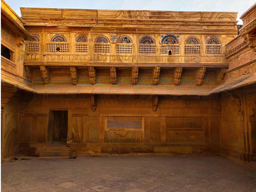
Az erődítménytől nem messze áll több dzsaina szent monumentális szobra.